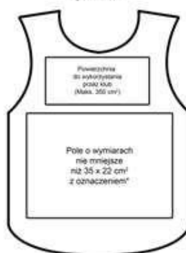
STANDARDOWE ZAGOSPODAROWANIE POWIERZCHNI -tył znacznika

*Największy kolor białego w jednym kolorze (PS, TV, RP, Ty, TV, FOTO) o wyjątkowo nie-mniejszej niż 13 cm - kolor „Tabela Biał”. Zobacz również wymagania dotyczące kolorów używanych w sportach (CIE L 98,032,000; 98,032,000) i wyjątkowo tylko nie-mocno czarna (MEDIAS KLUB) o wyjątkowo nie-mniejszej niż 8 cm - kolor „Tabela Biał”.