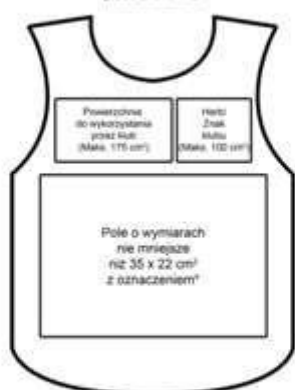
STANDARDOWE ZAGOSPODAROWANIE POWIERZCHNI -przód znacznika

*Największy kolor białego w jednym kolorze (PS, TV, RP, Ty, TV, FOTO) o rozmiarach nie mniejszych niż 13 cm - kolor „Tabela Biał”. Zobacz również wymagania dotyczące kolorów używanych w sportach (CIE L 98,032,000; 98,032,000) i wyjątkowo tylko nie-mocno czarna (MEDIAS KLUB) o wyjątkowo nie-mniejszej niż 8 cm - kolor „Tabela Biał”.